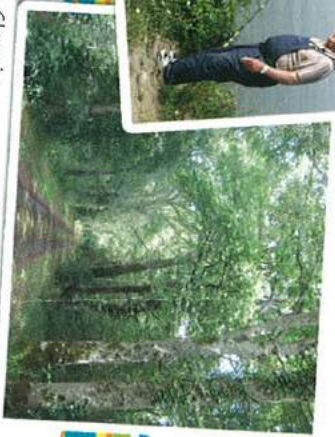
Chemin en sous-bois