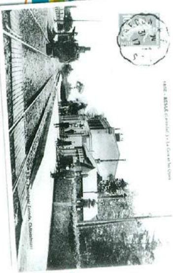
Gare de Beslé-sur-Vilaine