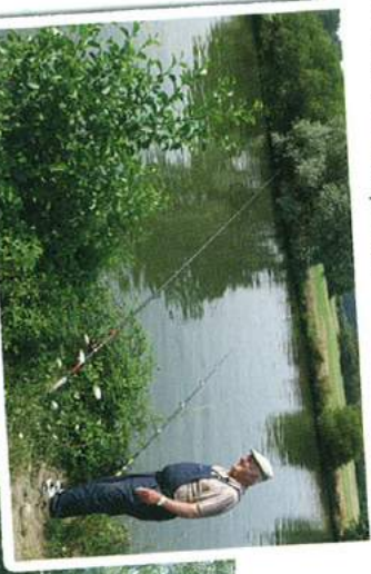
Pêcheur au bord de la Vilaine

Appréciez le calme au bord de l'eau, la beauté des sentiers ombragés, la halte nautique de Beslé-sur-Vilaine, section de commune de Guéméné-Pentao. Ce circuit familial descend par une petite route puis par des sentiers pour rejoindre les bords de la Vilaine et remonter doucement vers le bourg.